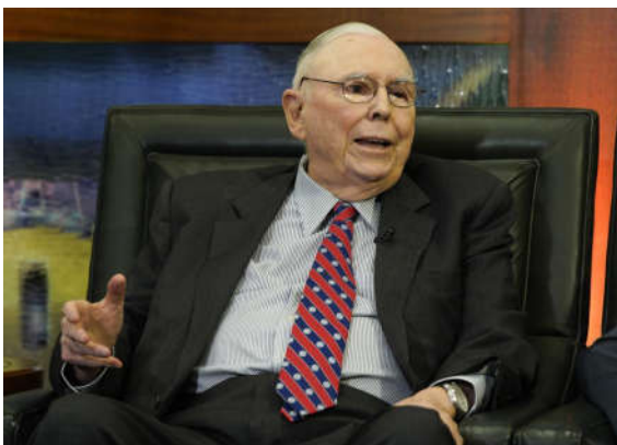
ชาร์ลีส มังเกอร์ (Charlie T. Munger)

“เงินก้อนใหญ่ที่สุด ไม่ได้อยู่ในการซื้อหรือขาย แต่อยู่ใน...การรอคอย”